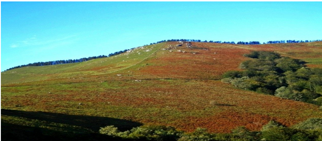
LEUNETA 887 mts